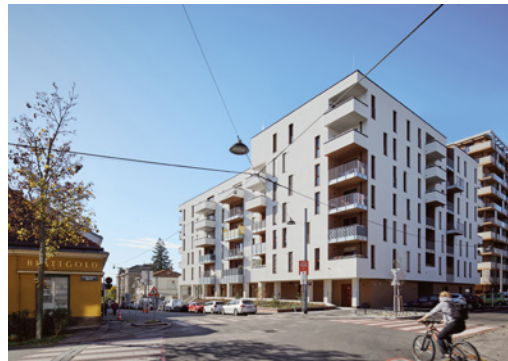
BWM_Spallartgasse_BP 7_© BWM_Designers & Architects_Lukas Schaller