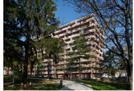
BWM_Spallartgasse_BP 6_© BWM_Designers & Architects_Lukas Schaller