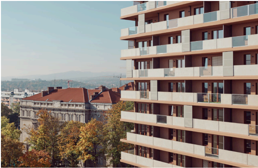
BWM_Spallartgasse_View2_© BWM_Designers & Architects_Lukas Schaller