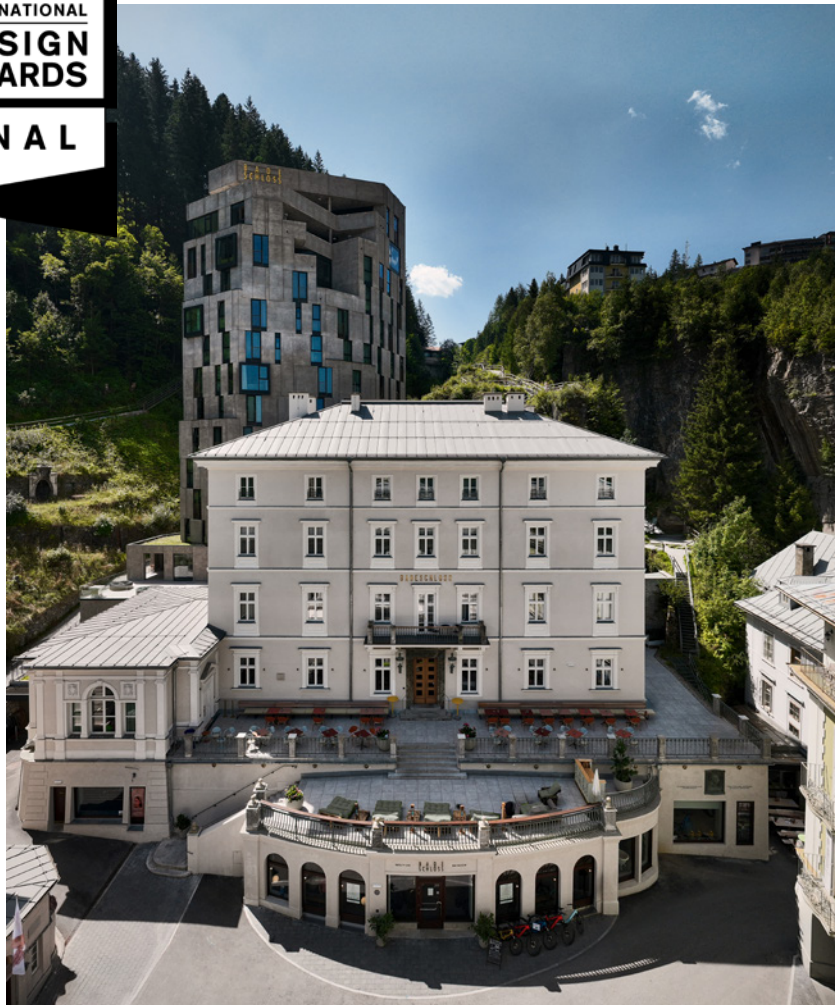
BWM_Bad Gastein_Hotel Badeschloss_Ensemble