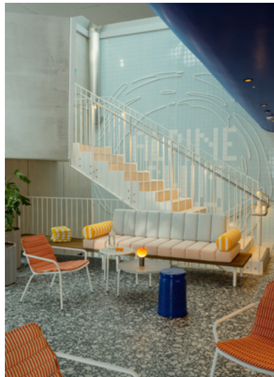
BWM_Bad Gastein_Hotel Badeschloss_Spa 01