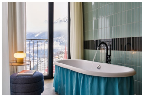
BWM_Bad Gastein_Hotel Badeschloss_Junior Suite New Building © BWM_Designers & Architects_Ana Barros