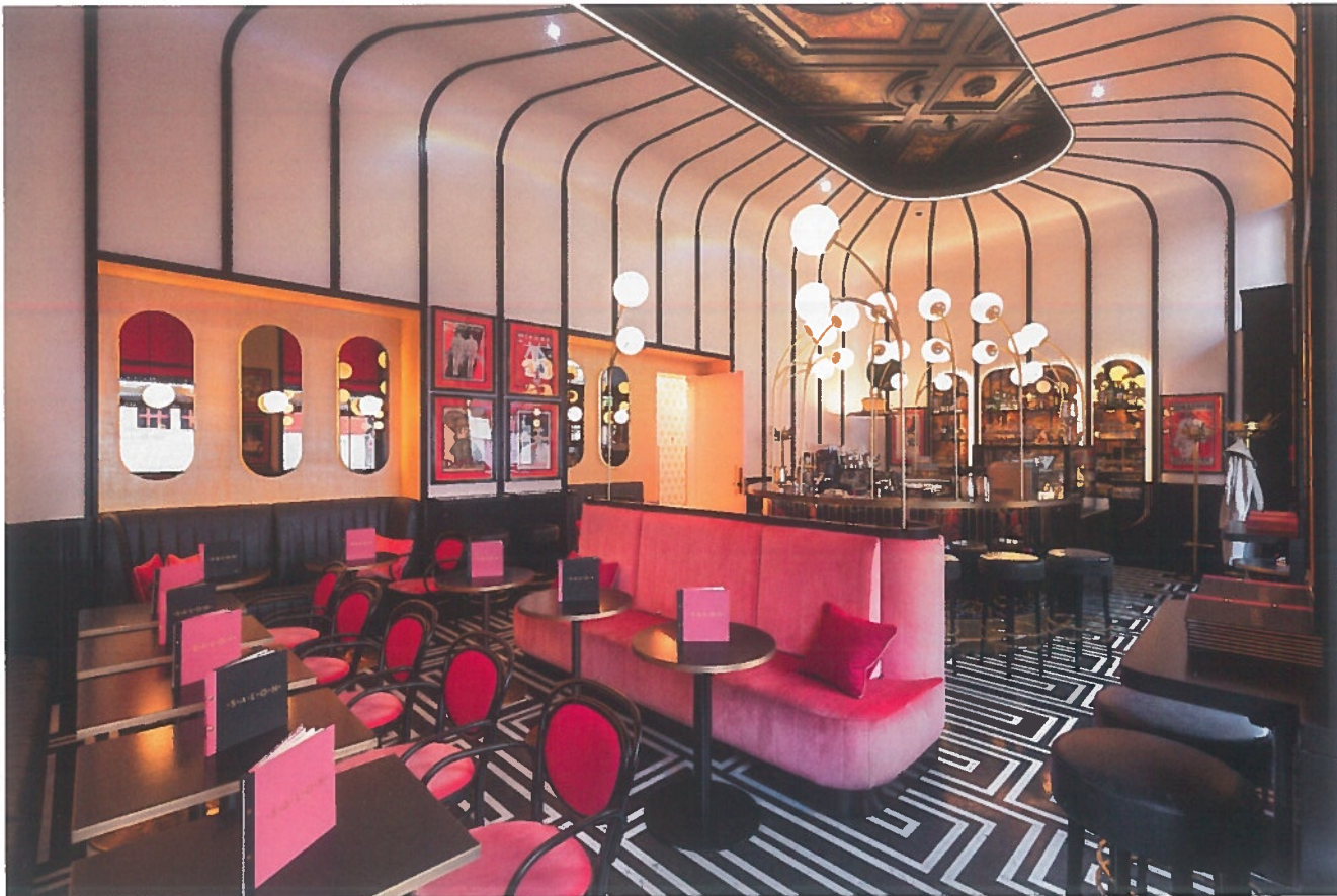
Die Thonet-Stühle sind original, die Polsterung ist natürlich neu.