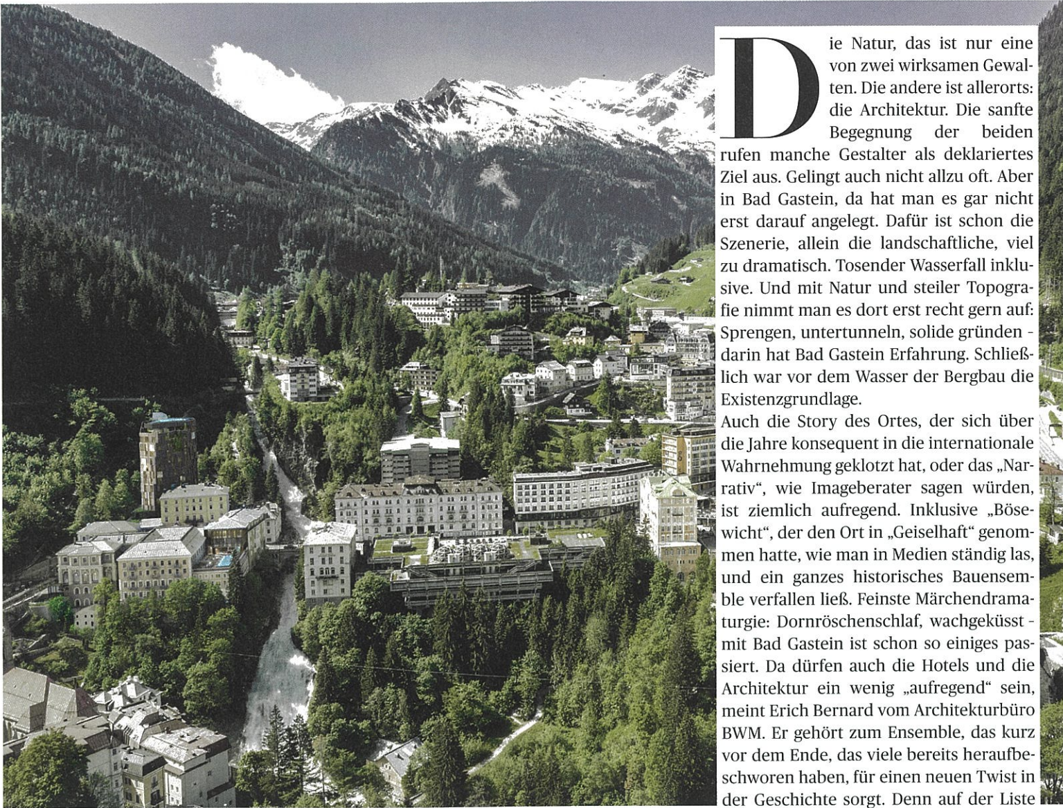
BAD GASTEIN. Der „Klotz“ gehört zur gängigen Ikonografie. Am Straubingerplatz siedeln sich neue Geschichten an.