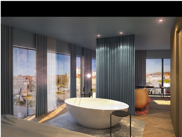
Schaumbad mit Ausblick im Galantha. c BWM Architekten