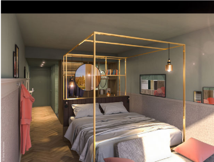
Stilvoll - die Zimmer in Eisenstadt. c BWM Architekten

Klicke hier für Foodie-Tipps im Burgenland!