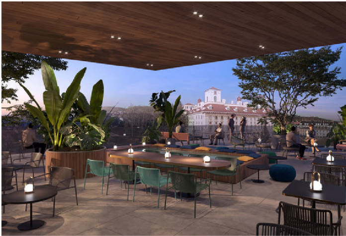
Die erste Rooftop Bar im nördlichen Burgenland. c BMW Architekten