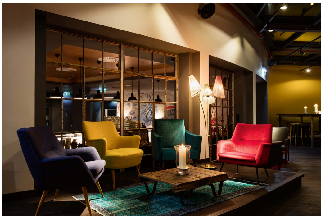
Im »Ruby Marie« steht Vintage hoch im Kurs.

Ein ganz besonderes Hotel ist das »Magdas«. Als »Social Business Hotel« bringt es Menschen aus aller Welt zusammen und bietet auch jenen mit Fluchterfahrung Jobs und Ausbildungen in Gastronomie- und Hotellerieberufen. Neben dem unterstützenswerten sozialen Aspekt punktet das Hotel mit Vintage de luxe. Die Designer von BWM Designers + Architects haben für die Einrichtung viele alte, teils auch originale Möbel restauriert und geschickt in das neue Design integriert. So sind die Trennwand im Veranstaltungsraum sowie alle Lampen und Kleiderständer Fundstücke aus dem Haus. Auch ein Teil der Betthäupter wurde aus diesem alten Holz gefertigt. Die Holzelemente an der Bar stammen von einem ehemaligen Beichtstuhl. Die Suiten wurden mit Originalmöbeln des Hauses aus den 60er-Jahren gestaltet. Vieles wurde neu interpretiert, neu bezogen und aufgepolstert, aber immer ganz im Sinne des alten Spirits.